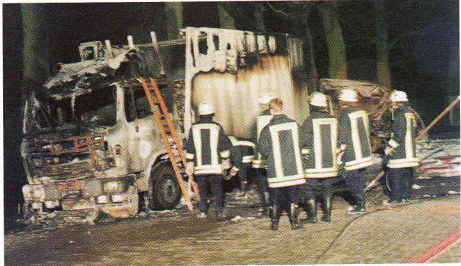
Über die Hofbeleuchtung und durch zusätzliche Scheinwerfer der Feuerwehr wurde die Einsatzstelle gut ausgeleuchtet. Hier begannen gerade die Nachlöscharbeiten an den Lkw.