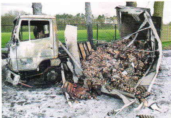
Zwei 7,5-Tonner brannten vollständig aus. Der Aufbau des zweiten Lkw brach regelrecht auseinander. Gut ist die zerstörte Ladung zu erkennen: Tausende Eier.

Landeskriminalamt Düsseldorf: zwei Beamte mit einem Fahrzeug.