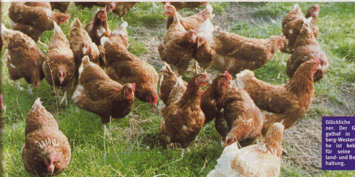
Glückliche Hühner. Der Geflügelhof in Rietberg-Westerwiehe ist bekannt für seine Freiland- und Bodenhaltung.

Zwischenzeitlich sperrte die Feuerwehr den kompletten Bereich um den vierten Lkw ab. In der Nähe herrschte vorsorglich absolutes Verbot von Funkgeräten und Funkmeldern. Die gesamte Einsatzstelle wurde mit Stativen und Scheinwerfern ausgeleuchtet.