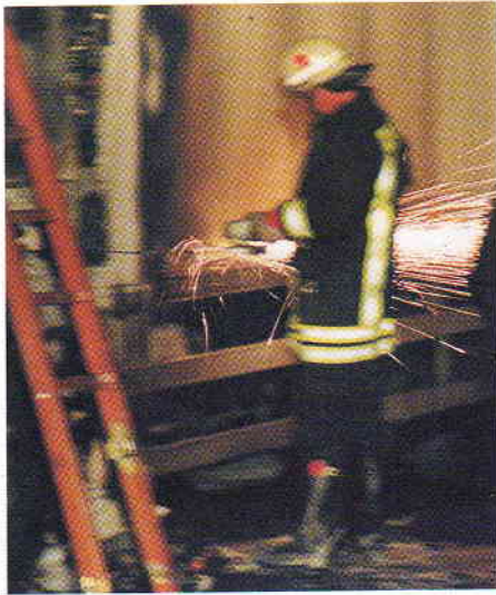
Um an alle Brandnester in den Lkw zu kommen, musste die Feuerwehr einen Aufbau mit dem Trennschleifer öffnen.