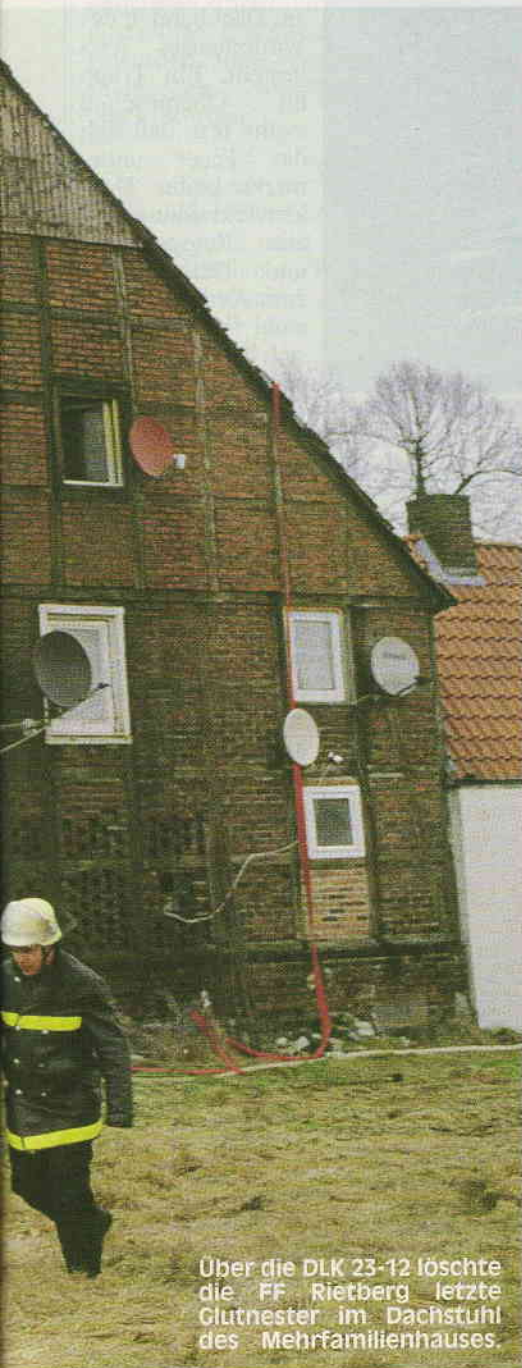
Über die DLK 23-12 löschte die FF Rietberg letzte Glutnester im Dachstuhl des Mehrfamilienhauses.