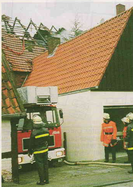
Die Zufahrt zur Rückseite des Brandobjektes erforderte fahrerisches Können von den Maschinisten.

chen. Das Haus liegt im Ortskern von Neuenkirchen (Kreis Gütersloh) an der Hauptstraße, schräg gegenüber der katholischen Pfarrkirche. Durch die enge Bebauung grenzen die Nachbarhäuser teilweise direkt an das Gebäude. Das Vorderhaus ist über zwei unabhängige Treppenräume zu erreichen.