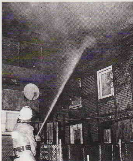
Im 2. Obergeschoß des Fachwerkhäuses brach das Feuer aus. Über ein TLF 16/25 nahm der Löschzug Rietberg ein erstes C-Rohr vor.