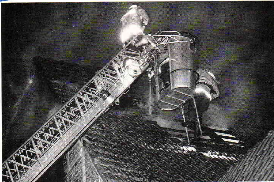
Unter Atemschutz stieg ein Feuerwehrmann vom Korb der Drehleiter vorsichtig auf das Dach, um den Dachstuhl zu öffnen.

Um den Bedarf an Atemschutzgeräten und -flaschen sicherzustellen, forderte die Einsatzleitung den AB-Atemschutz von der Hauptamtlichen Wache